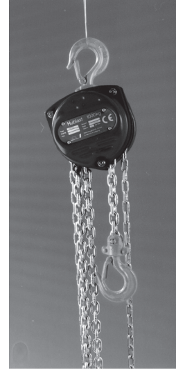
Flaschenzug Profiline P 90

Weitere Produktbereiche: Hydraulische Hubtische Seilzüge Elektrokettenzüge